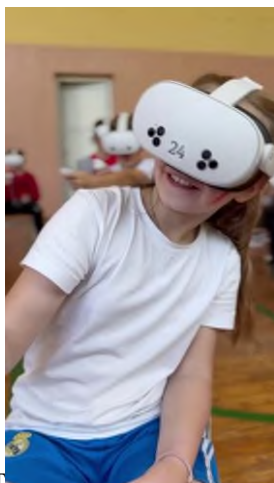
1.1. Игра в Виаг очках - 30 минут