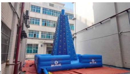
1.2. Надувной скалодром